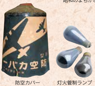
防空カバー 灯火管制ランプ