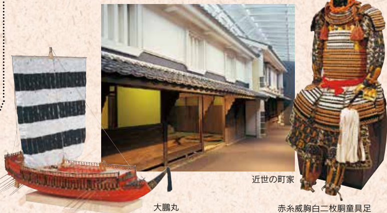
大鵬丸 近世の町家 赤系威胸白二枚胴具足

太平に向かう伊予・伊予八藩・幕藩体制下の人々の生活・近世の交通・伊予の学問・幕末の伊予