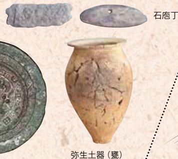
相の谷1号墳出土 獣紋鏡 弥生土器(甕) 石磨丁

海の形成と愛媛県最古の人々・縄文時代の人々の生活・弥生時代の人々の生活・大和朝廷と伊予・伊予の律令体制・古代信仰の広がり・海舟運と藤原純友の乱